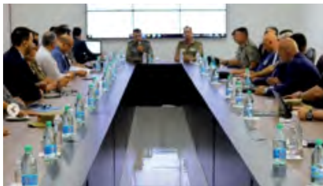
Fórum de Entidades Representativas dos Serviços e Servidores Públicos de Goiás após primeira reunião com equipe econômica do Governo