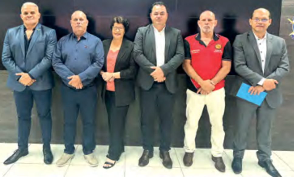
Representantes das entidades militares durante reunião sobre a data-base

Unimil e demais associações e sindicatos militares e civis lutam por data-base e outras melhorias