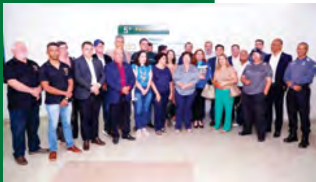
Entidades representativas dos militares em tratativa sobre a LOB